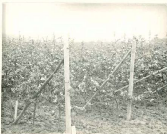
KVETOUČÍ DRUŽSTEVNÍ SAD U ŽÍMU