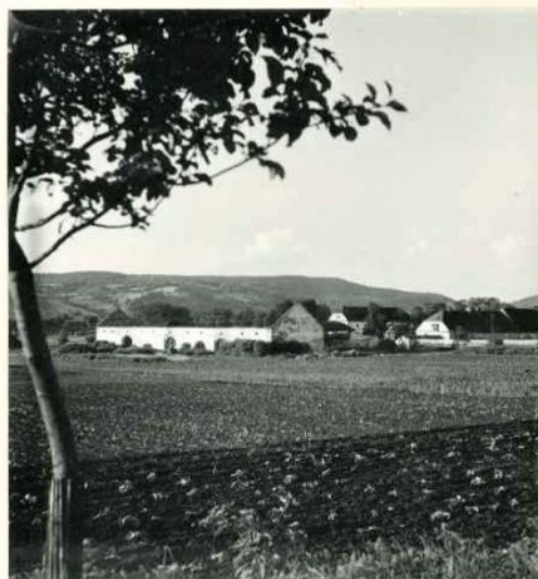
VYHOŘELÁ STODOLA ČSSS