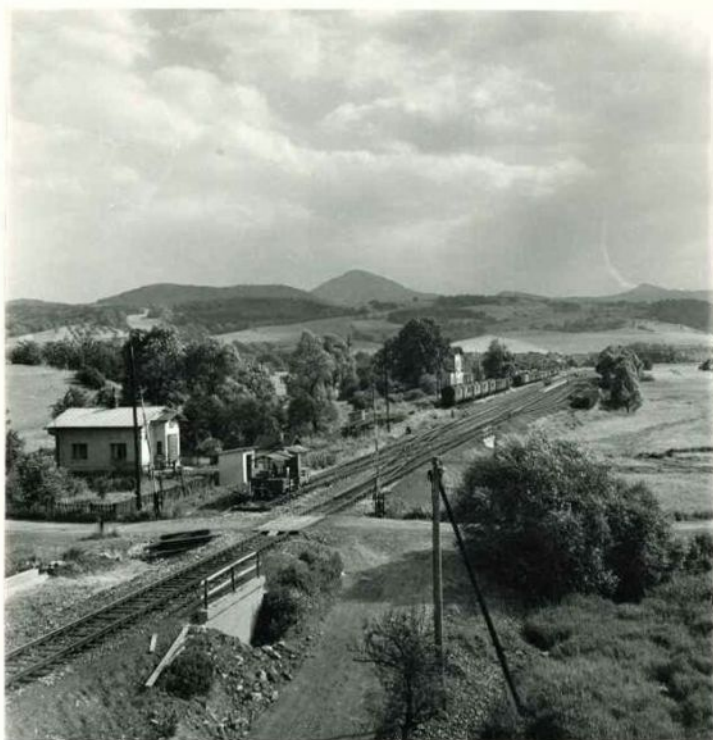
POHLED NA ROZŠÍŘENÉ NÁDRAŽÍ