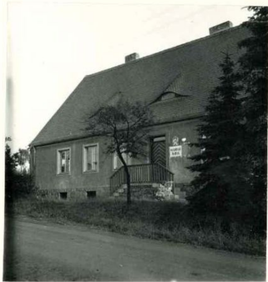
BUDOVA MATEŘSKÉ ŠKOLY