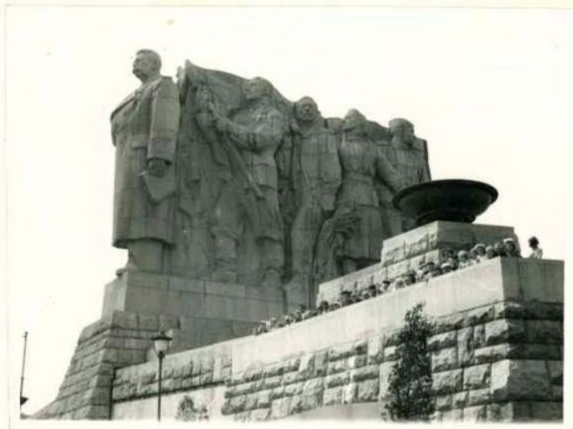
NÁRODNÍ ŠKOLA Z ŘEHLOVIC NA VÝLETĚ U POMNÍKU J.V. ŠTALINA V PRAZE R. 1958

(DOMNÍK ODSTRANĚN R. 1961 V SOUVISLOSTI S LIKVIDACÍ KULTU OSOBNOSTI)